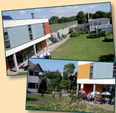
Sport- und Bildungszentrum